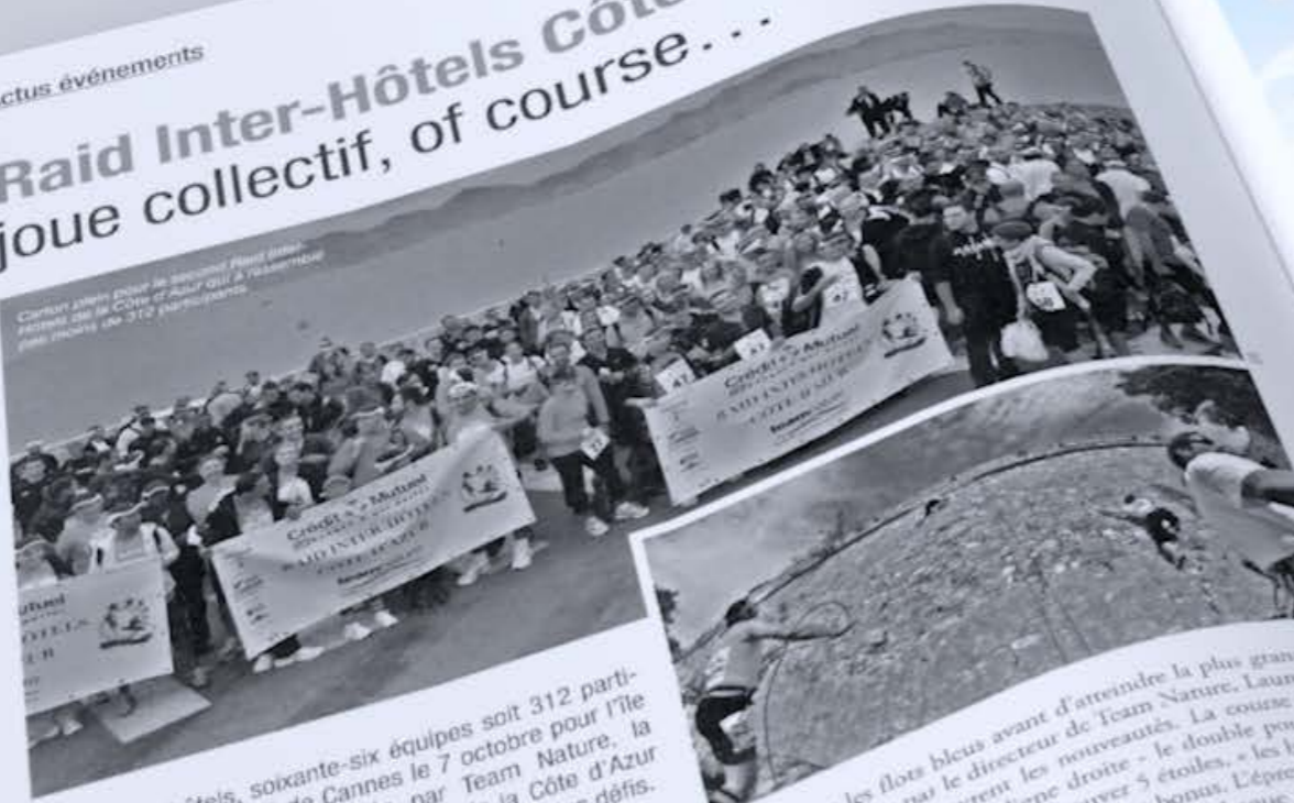
Carton pour le second Raid Inter-Hôtels de la Côte d'Azur qui a rassemblé plus de 312 participants.

Trente-trois hôtels, soixante-six équipes soit 312 participants ont embarqué de Cannes le 7 octobre pour l'île Sainte-Marguerite... Organisée par Team Nature, la seconde édition du Raid Inter-Hôtels de la Côte d'Azur (RIHCA) s'affirme comme le challenge de tous les défis.